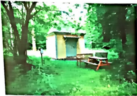
Lusthuset i Vinberg byggt 2011 som ett examensarbete av snickaren och kulturvårdaren Johan Svensson. Lusthuset är byggt med 1700-talsmetoder och med tidstypiska material och färger. Invändigt är det målat av en konservator och sedan i somras finns här informationstavlor som berättar om Dalins liv och verk.